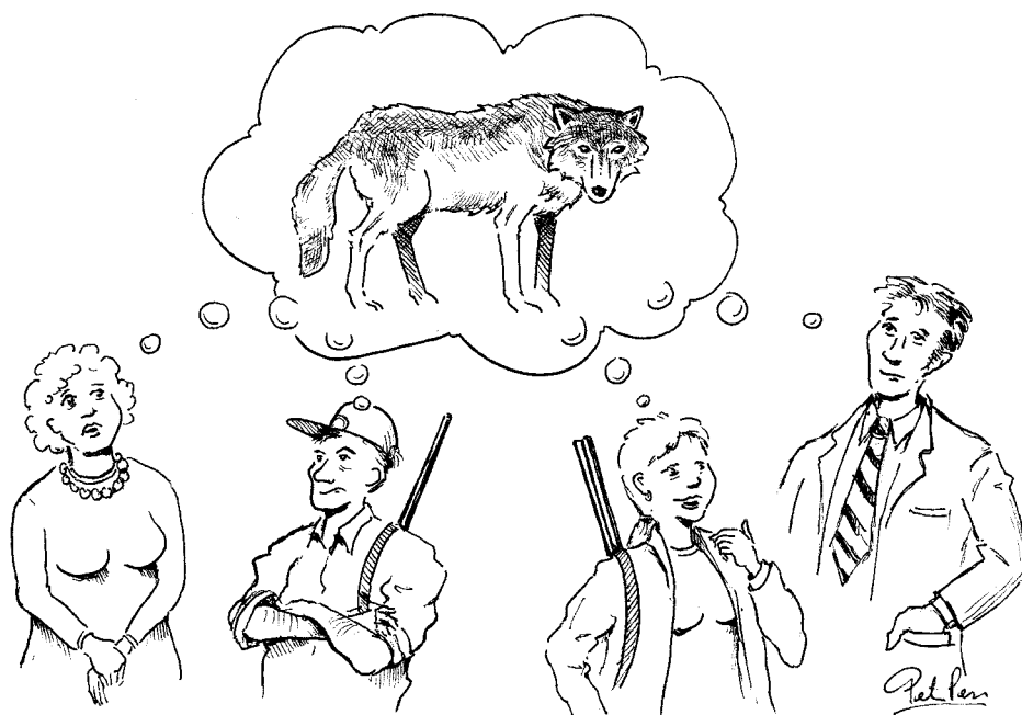
illustration: Peter Robertz