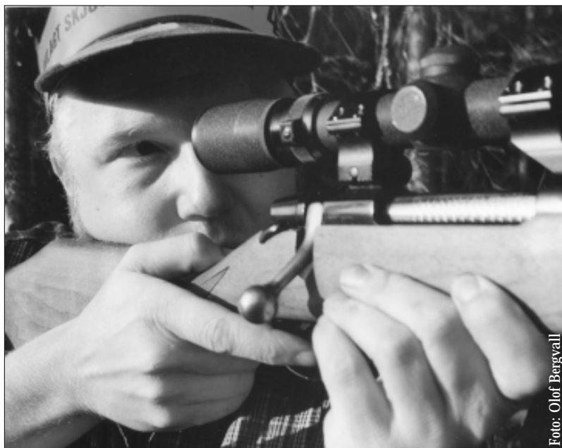
Tretton procent av svenskarna lever i ett hushåll med minst en jägare.

den. När vi gjorde en fördjupad analys av varför de tillfrågade är positivt inställda till jakt visade det sig vara fyra faktorer som påverkade inställningen till jakt, nämligen;