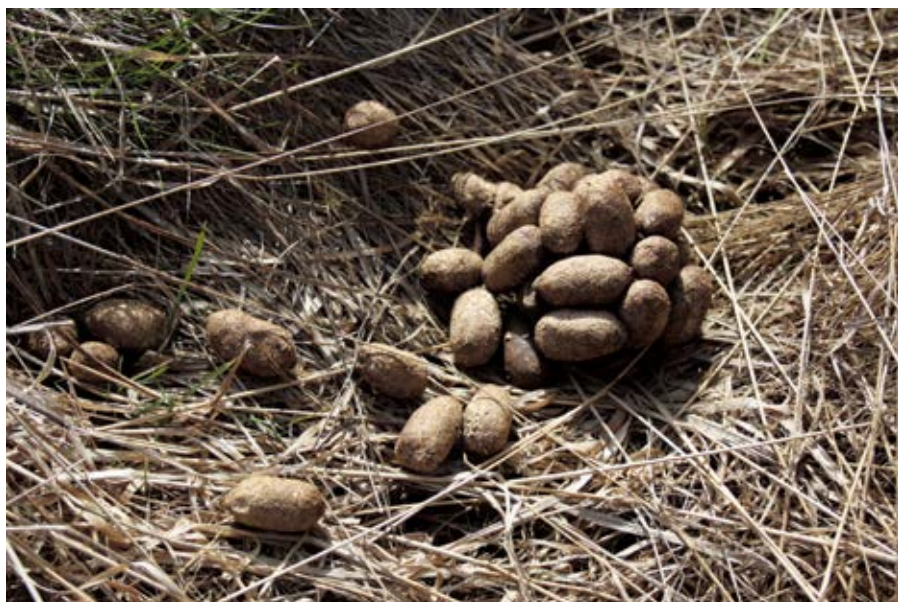
Figur 4. Spillningsinventering är en av de inventeringsmetoder som ger kunskap till älgförvaltningen.

inventeringar förtydligas. Vidare är det viktigt att syftet med inventeringarna även kommuniceras ner till gräsrotsnivån, och att den enskilde jägaren och markägaren ges möjlighet till ett individuellt ansvar för förvaltningen.