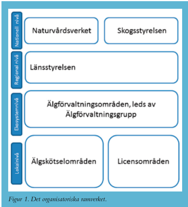
Figur 1. Det organisatoriska ramverket.

■ Från januari 2012 förvaltas älg i Sverige genom en ekosystembaserad, adaptiv och lokal förvaltning med en ny struktur vad gäller roller och ansvarsområden, från myndigheter, älgförvaltningsgrupper och ut till älgskötselområden och jaktlag (Figur 1). De ska tillsammans arbeta för att nå gemensamma mål för älgförvaltningen. För att sätta mål krävs kunskap dels om älgens ekologi, dels om betesresurserna. Inventeringar är de förvaltningsverktyg som utgör det underlag som älgförvaltningens mål sätts och anpassas utifrån.